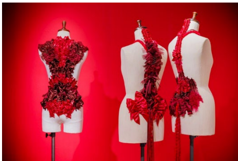
《背中、ちょうちよの巣》2023年、 のん Ribbon 展 怪しくて、可愛いもの。(仙台)